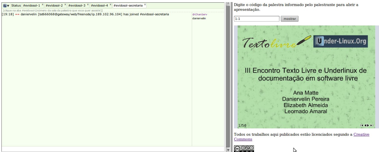
Figura 2: imagem do chatslide em funcionamento ( http://portugueslivre.org/chatslide/ )

O Chatslide tem sido melhorado por nossa equipe para permitir a apresentação de slides ao lado da sala de chat. Atualmente, estamos fazendo testes para que o programa permita apresentação não só no formato flash, mas PPT, DOC, ODF, PDF, convertidos em HTML.